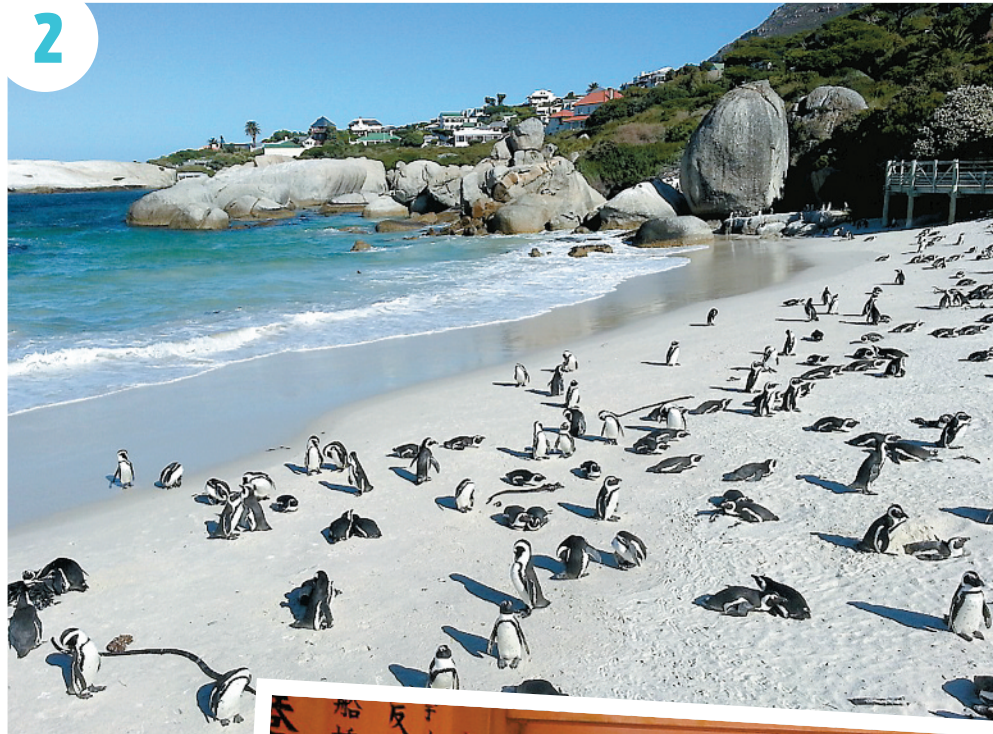
● 1. La montagne de table au Cap. ● 2. Des manchots par centaines à Boulders Beach. ● 3. Le sanctuaire Fushimi Inari à Tokyo. ● 4. Présentoir de sushis tridimensionnel en plastique. ● 5. À l'aube sur le Gange à Varanasi.